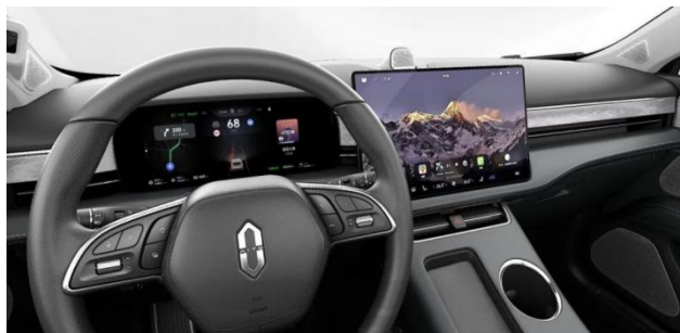
图19: 华阳为问界 M5 配套 10.25 寸高清液晶仪表