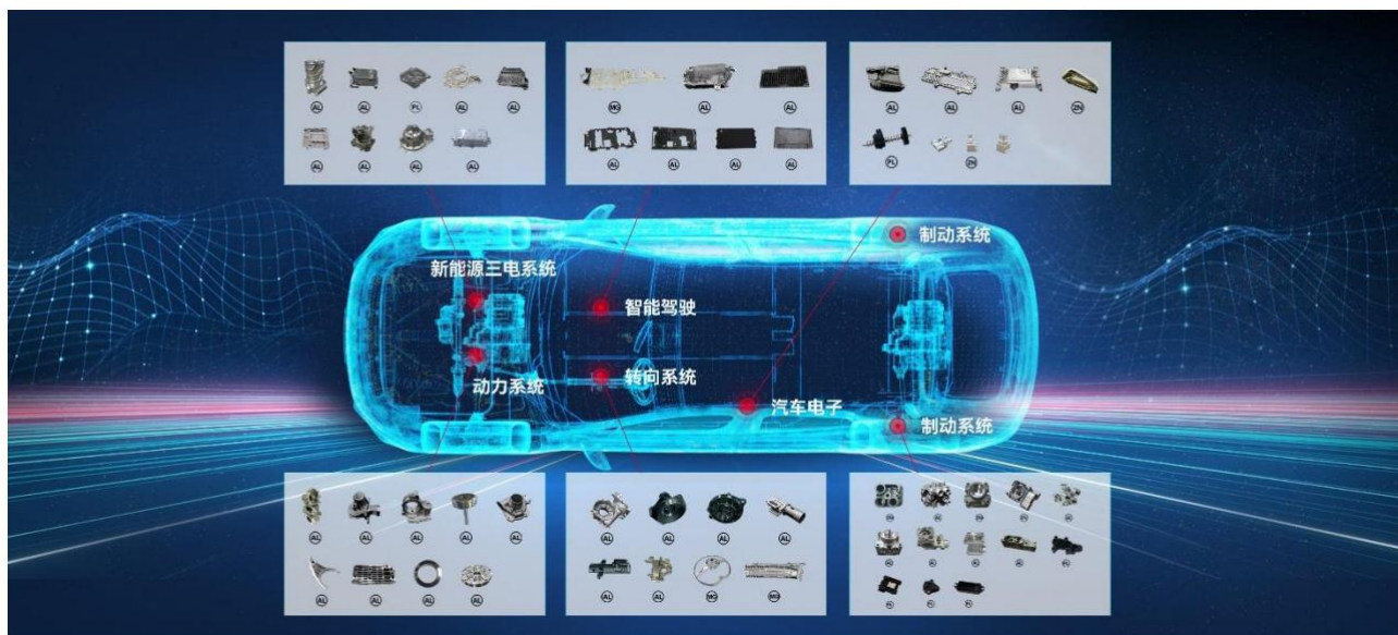
图21：公司精密压铸产品在汽车的应用领域示意图