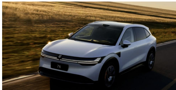
图13: 极氪 7x