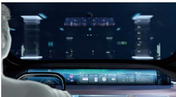
图6: 华阳集团座舱域控制器

公司加大研发投入推动产品扩展和迭代，产品和技术取得新突破，打开增量空间。2024 年上半年，公司研发投入 3.73 亿元，同比增长 25.57%，占营业收入的 8.90% 公司汽车电子产品和技术快速迭代、推出多功能融合创新产品： 汽车电子业务推出多功能融合产品，引领行业技术趋势。公司推出基于高通 8255 芯片的舱泊一体域控产品；同步开发基于高通 8775 芯片的舱驾融合和中央计算单元产品，预计今年下半年推出。公司融合 HUD 光学显示及车载屏幕显示技术在国内率先推出 VPD (Virtual Panoramic Display 虚拟全景显示) 产品，带来简洁的座舱设计和新的体验，定点项目预计明年实现量产，并规划其下一代的融合方案；结合屏显示及精密运动机构的滑移屏、偏摆屏、吸顶屏、悬浮屏等项目逐步增多。公司座舱域控、行泊一体域控产品搭载更高算力芯片，融合大模型平台迭代，进一步提升人机交互体验；HUD 产品在光波导、可变焦投影技术中取得技术突破，AR 生成器 (AR Creator) 在延迟性、精准度及 UI 显示性能等各方面进一步提升，已率先实现 5.1 寸 TFT HUD 量产；车载显示屏产品不断提高显示画面的色彩饱和度及画面精细度，公司加大 OLED 显示技术研发和生产投入，量产项目增多，并完成了可折叠 P-OLED (Plastic OLED) 显示屏及三轴运动机构的车载显示产品预研；公司电子外后视镜产品在系统启动速度、画面亮度及流畅度、视野扩展度、软件与硬件的可靠性等方面有明显提升，并构建了完善且高效的光学测试体系，自研的视野仿真软件已投入使用，首个项目已进入量产阶段；数字声学产品持续创新，新增谐波增强、3D 空间音效、临境人声等多项音效，增强“声临其境”的用户体验；已推出适配 iPhone 的基于 Qi2.0 的磁吸无线充电产品和基于 48V 供电系统的无线充电产品，扩大产品应用范围。其中，华阳运动机构支持整车解决方案，涵盖屏幕、喇叭、香氛三个大类，同时正在扩展内饰及车外运动机构品类，目前。华阳运动机构系统解决方案的多款应用产品已实现量产并获得国内外客户的认可，如小鹏 X9 悬浮屏机构、岚图 Free 升降三联屏机构、理想 MEGA 吸顶屏机构、魏牌蓝山吸顶屏机构、极氪 001 偏摆屏机构、极越 01 升降喇叭、蔚来 ES6 智能香氛机构等，持续助力车企客户赋能智能交互，提升驾乘者的第三生活空间体验感。