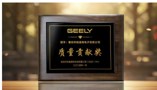
图15: 华阳通用获得吉利汽车 2023 年度“质量贡献奖”奖项”