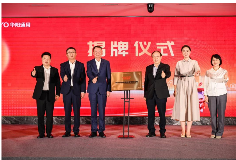
图20: 重庆华阳通用科技有限公司(华阳通用重庆子公司)在两江新区揭牌成立

9月26日, 重庆华阳通用科技有限公司(华阳通用重庆子公司)在两江新区揭牌成立, 将致力于智能座舱、智能驾驶两大领域, 不断加大技术研发投入, 提升自主创新能力, 努力在汽车电子智能化领域取得更多突破性成果。活动现场, 两江新区与华阳集团还签订了战略合作协议, 双方将紧密合作, 推进华阳集团进一步在两江新区深化布局, 实现跨越式发展。