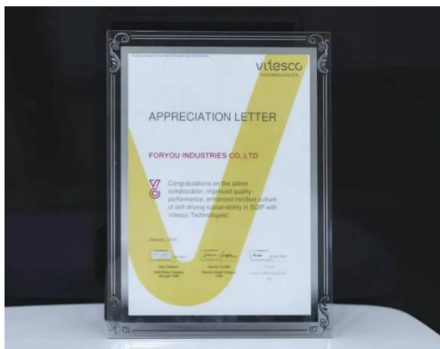
图22: 华阳精机荣获“纬湃全球质量优秀奖”