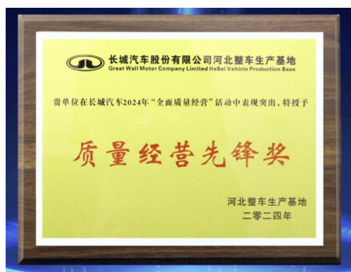
图14: 华阳多媒体获得长城汽车“质量经营先锋奖”

2024 年上半年, 公司产品质量交付方面取得客户高度认可, 获得较多奖项。全资子公司华阳通用获得长安深蓝“卓越贡献奖”、哪吒汽车“优秀质量奖”、长安马自达“J90A 项目供应链创新典范奖”、深圳市汽车电子行业协会“2023 年度汽车电子科学技术奖-突出创新产品奖”, 华阳多媒体获得长城汽车“质量经营先锋奖”, 华阳精机获得联电“最佳商务合作奖”、博格华纳传动与电池系统“优秀供应商”奖、海拉“最具价值奖”、佛瑞亚集团“价值创造奖”、捷普“质量奖”等。