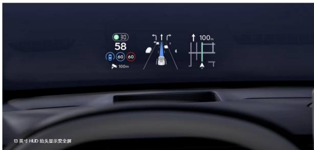
图12: 华阳集团为乐道 L60 配套 HUD

五座 SUV 极氪 7X，以三种版型 —— 后驱智驾版、长续航后驱智驾版和长续航四驱智驾版精彩亮相，同期开启全国批量交付， 华阳为极氪 7x 配置了 36 英寸 AR-HUD，携手极氪共筑智能出行新高度。