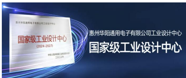
图1: 华阳通用荣获“国家级工业设计中心”认定