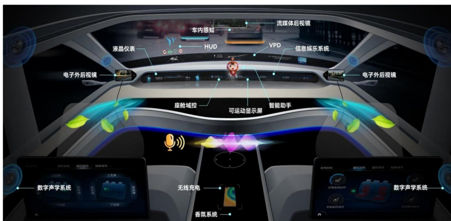
图3: 公司汽车电子智能座舱产品应用场景示意图

产品维度, 公司汽车电子业务围绕“智能座舱、智能驾驶、智能网联”三大领域, 主要面向整车厂提供配套服务, 包括与客户同步研发、生产和销售。市场和技术双轮驱动, 根据市场趋势, 通过产品和技术快速迭代, 扩展产品线, 为客户提供丰富的、前瞻性的解决方案。在智能座舱领域, 公司坚持以用户体验和使用价值为导向, 集成软硬件系统和丰富的生态资源, 并运用多种创新的人机交互技术, 围绕智慧出行、万物互联的应用场景, 向客户提供先进的智能座舱解决方案, 为用户提供沉浸式的智能座舱体验。在智能驾驶领域, 公司依托高性能计算平台、多传感器融合、驾驶辅助控制算法以及智能网联技术, 从低速泊车场景向高速自动驾驶场景延伸, 提供人-车-路-云协同的智能驾驶解决方案, 打造安全便捷的用户驾乘体验。