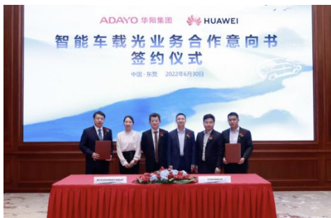
图18: 华阳与华为签署智能车载光业务合作意向书