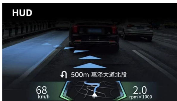
图7: 华阳集团 HUD 产品