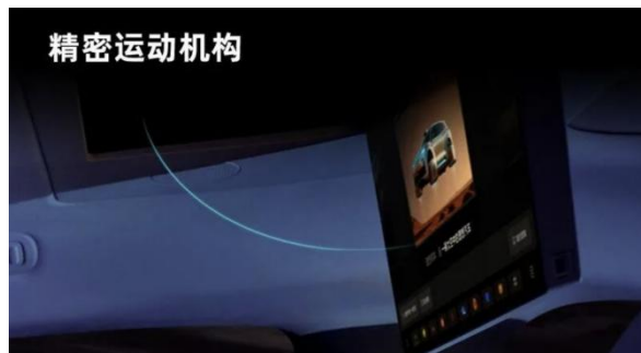
图9: 华阳集团精密运动机构产品