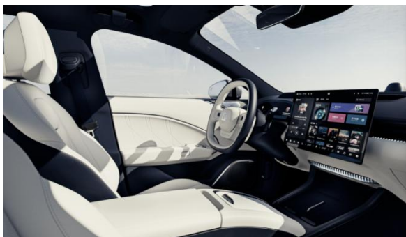
图10: 极氪007搭载由华阳配套的可偏转式15.05英寸2.5K OLED向日葵中控屏

公司汽车电子新品持续放量, 客户结构优化。 2024H1, 公司座舱域控、精密运动机构、数字声学等新产品线陆续进入规模化量产阶段, 销售收入同比大幅增长; 屏显示、液晶仪表、HUD、车载无线充电、车载摄像头等已规模化量产产品销售收入大幅增长; 客户结构持续优化, 奇瑞、吉利、赛力斯、北汽、长安福特、广汽、理想等客户营收大幅提升。2023年11月17日, 极氪智能科技旗下首款纯电豪华轿车极氪007首次全球公开亮相, 并开启预售, 极氪007搭载了由华阳配套的可偏转式15.05英寸2.5K OLED向日葵中控屏, 作为智能座舱人机交互的重要载体, 该屏融入了华阳多项设计理念、创新技术和先进工艺, 外形采用7mm超窄边框设计, 使屏幕占比高达87%以上, 且边缘厚度仅6mm。2024年6月30日, 长城汽车魏牌蓝山智驾版, 以全程视频直播的形式, 在重庆繁忙且复杂的路段上, 真实地展示其全场景NOA智能驾驶系统出色的技术实力, 华阳为蓝山开发了29英寸超大SR-HUD (Simulated Reality Head-up Display, 模拟现实抬头显示器), 创新性加入的SR信息显示, 通过模拟外界交通环境, 可以更好地呈现道路信息, 为用户建立驾驶信任感, 成为率先实现5.1吋TFT HUD量产的HUD供应商, 此外, 蓝山智驾版配置17.3英寸后排娱乐屏, 强化了车辆的科技属性和娱乐属性, 华阳为后排娱乐屏配置吸顶屏精密运动机构, 该运动机构支持高负载、可自锁、堵转、防夹等多重保护功能。