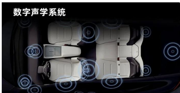
图8: 华阳集团数字声学系统产品