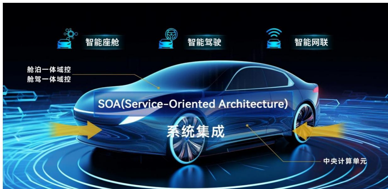
图5：公司汽车电子域控制器产品

此外，公司顺应汽车 EE 架构变化的趋势，以 SOA 架构为桥梁，通过敏捷开发、配置化管理等实现跨域功能融合和快速稳定交付。公司已推出舱泊一体域控产品，正在研发舱驾一体、中央计算单元等跨域融合产品，持续提升汽车电子系统集成优势。