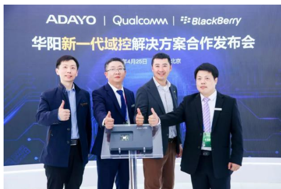
图16: 华阳&高通&黑莓三英联手，华阳新一代域控产品亮相北京车展

2024 年 6 月 21-22 日，在华为开发者大会 2024（HDC 2024）上，华阳与华为签约了两项重要合作： HMS for Car 全面合作协议与 HUAWEI HiCar 集成开发合作协议 。HMS for Car 智能车载解决方案，聚焦地图导航、AI 语音、应用生态、流量服务领域，通过核心产品力的不断优化与创新，提供全方位智能化的极致车载服务，赋予汽车更为智慧便捷的出行优势；HUAWEI HiCar 是为人+车+家全场景智慧互联解决方案，旨在通过手机与车机的连接，实现手机与车机的深度互动和无缝体验。基于 ICCE 智慧车联产业联盟的融合互联 API 标准，HUAWEI HiCar 已成为手机车机互联的主流之一，汽车的智能座舱可按需调用手机的软硬件资源并持续构建产品差异化竞争力。此外，代码开放也将赋能生态伙伴在智能化变革浪潮中快速迭代升级产品与服务。在华为两大平台的技术优势加持下，华阳的智能座舱产品将能为用户带来更便捷、智能、安全的移动出行体验，并更好地助力车企汽车产品从出行工具向智能终端进化。