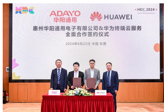
图17: 华阳与华为达成两项重要合作：HMS for Car 全面合作协议与 HUAWEI HiCar 集成开发合作协议