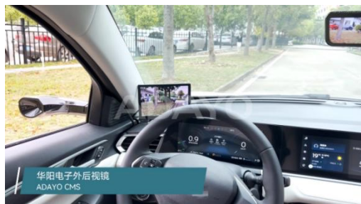
图2: 华阳集团电子外后视镜产品