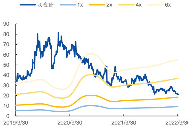
图 2：P/B Band