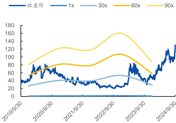
图 1：P/E Band