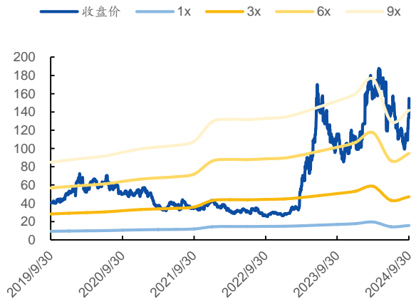
图 2：P/B Band