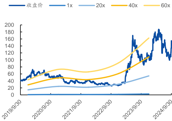
图 1：P/E Band