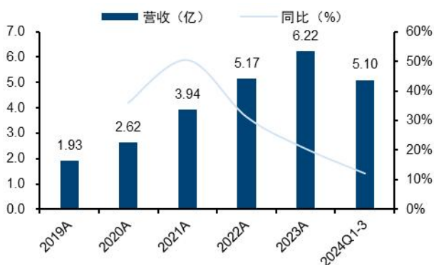
图1：药康生物营业收入及增速（单位：亿元、%）

分季度看，2024Q1/Q2/Q3 分别实现营收 1.57/1.83/1.69 亿元（分别同比+12.0%/+17.8%/+6.7%），归母净利润 2948/4686/2188 万元（分别同比-5.1%/+0.7%/-45.5%），扣非归母净利润 2287/3197/1697 万元（分别同比+2.7%/+17.2%/-47.2%）。