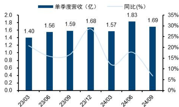
图2：药康生物单季营业收入及增速（单位：亿元、%）