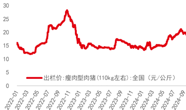
图表4：生猪均价（截至 24 年 9 月 23 日）