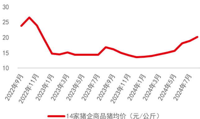
图表3：14家猪企出栏均价

根据搜猪网数据，8月全国生猪均价为 20.37 元/公斤，环比上涨 7.56%。14家上市公司出栏价同样上升明显，8月均价为 20.20 元/公斤，环比上涨 6.69%，同比上行 19.54%。除牧原、天康、神农和正邦等少数公司售价略低外，其余公司均突破 20 元/公斤。8月前期猪价继续高位上行，至中后期开始触顶回落。8月整体供给依然紧俏，叠加少量二育入场，推升猪价。往后看，供给端稍有增量但幅度不大，且叠加旺季消费即将来临，预计猪价下行空间有限。