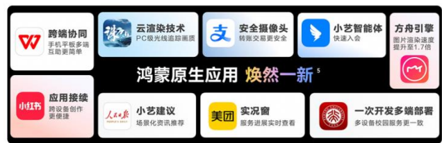
图表10 鸿蒙原生应用

鸿蒙原生版钉钉可实现跨设备会议无缝接续，只需将两台设备靠近，点击弹出的图标即可将会议无缝接续到另一台设备上。鸿蒙原生版高德地图支持导航接续，导航可以在车机和手机间无缝切换。鸿蒙原生版 WPS 支持跨设备复制粘贴和互通图库，用户可以在平板端直接调用手机图库和相机。小红书已完成鸿蒙原生应用全量版本开发，新增了对系统级未成年人模式、AI 抠图等鸿蒙特性的支持。支付宝鸿蒙版于 HarmonyOS NEXT 开放公测当天，在鸿蒙应用市场上线，除支付功能外，还可使用小程序实现点外卖、看电影、挂医保等功能。