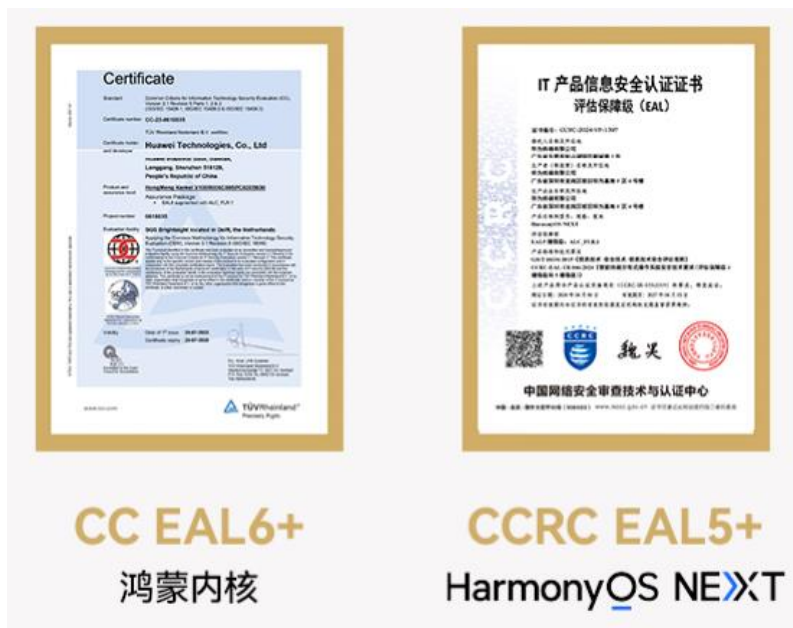
图表4 HarmonyOS NEXT 获得行业对高等级安全认证