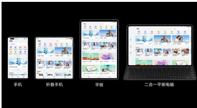
图表5 HarmonyOS “一次开发多端部署”