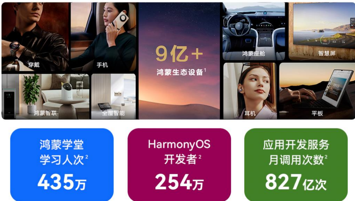
图表7 鸿蒙生态建设成果

坚持合作伙伴共创，鸿蒙生态持续完善。 鸿蒙生态坚持与伙伴、开发者和谐共生。鸿蒙坚持每年投入超过 60 亿元用于支持和激励鸿蒙开发者创新。目前，华为开发者联盟注册开发者数量已增长至 675 万，5 年时间增长了 10 倍以上。已经有 305 所高校开展鸿蒙课程，有 38 家专业人才培养机构参与鸿蒙人才培养，为鸿蒙操作系统走进千行万业奠定人才的基础。自 2024 年 6 月 21 日面向开发者和先锋用户启动 Beta 以来，HarmonyOS NEXT 已经更新了 6 个版本，收到超过一百万条的反馈建议，鸿蒙系统将在开发者和合作伙伴的共同努力下持续迭代与完善。目前，鸿蒙生态设备数量已超过 9 亿，多领域企业已启动鸿蒙原生应用开发，陆续加入鸿蒙生态。