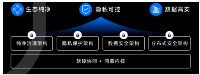
图表3 星盾安全架构