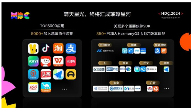
图表8 350+鸿蒙生态伙伴 SDK 已加入 HarmonyOS NEXT 版本适配

合作伙伴助力，降低鸿蒙应用开发门槛。得益于蚂蚁集团、中国银联、科大讯飞等千余家伙伴助力，通过开放垂域创新，贡献 mPaaS 等中间件，470 多款 SDK 正在适配原生鸿蒙，使得应用开发工作量最高可降低 90%。这些头部企业的技术积累，结合华为能力，共同铸造了鸿蒙操作系统的底座，为开发者提供完整的全链路开发工具，让千行万业开发鸿蒙应用、实现创新变得更加简单。数千企业内部办公应用也在加速上线，基于鸿蒙原生智能、跨端、安全能力，办公软件体验更安全、更智能，鸿蒙化办公成为科技新潮流。