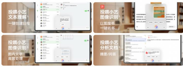
图表2 小艺智能体拥有强大的多模态识别和处理能力