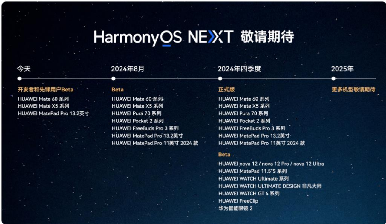
图表1 HarmonyOS NEXT 各机型开放时间节点

鸿蒙操作系统持续迭代。2019年8月9日，华为正式发布 HarmonyOS 1.0。随后，HarmonyOS 2.0、HarmonyOS 3.0、HarmonyOS 4.0 陆续推出。2023年8月4日，华为发布 HarmonyOS NEXT 开发者预览版。2024年1月18日，HarmonyOS NEXT 星河版正式面向开发者开放申请。2024年6月21日，在华为开发者大会 HDC 2024 上，华为正式发布鸿蒙最新版本 HarmonyOS NEXT，即“纯血鸿蒙”。2024年10月8日，HarmonyOS NEXT 正式开启公测，首批公测机型包括华为 Mate 60 系列、华为 Mate X5 系列、华为 MatePad Pro 13.2 英寸系列。