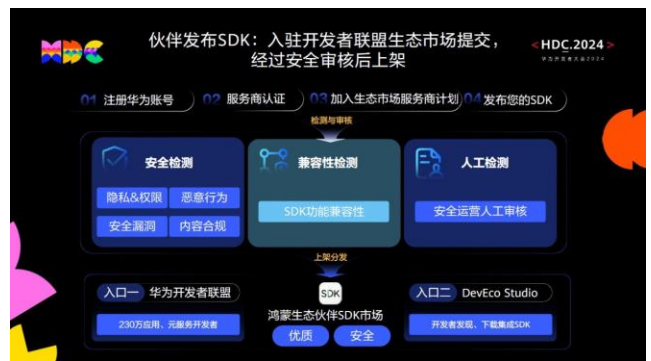
图表9 鸿蒙生态伙伴 SDK 市场提供安全 SDK 使用机制