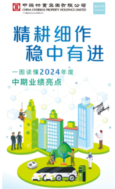
中海物业中期业绩亮点