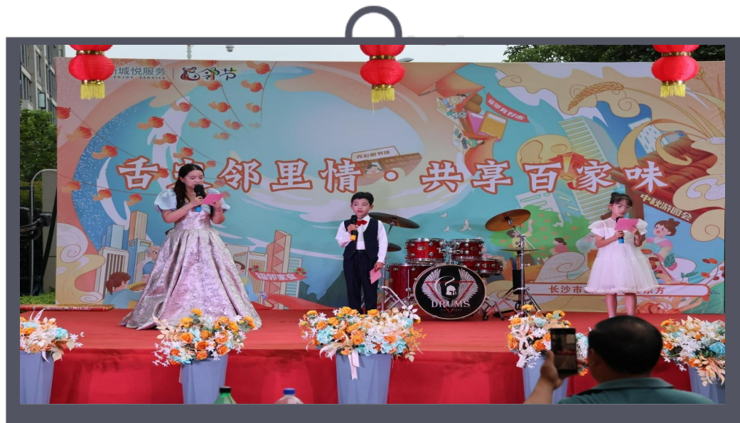
新城悦服务与业主共庆“福邻节”