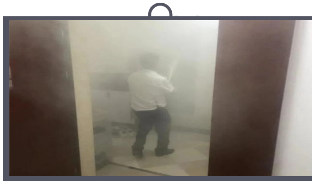
保利物业服务体系构建