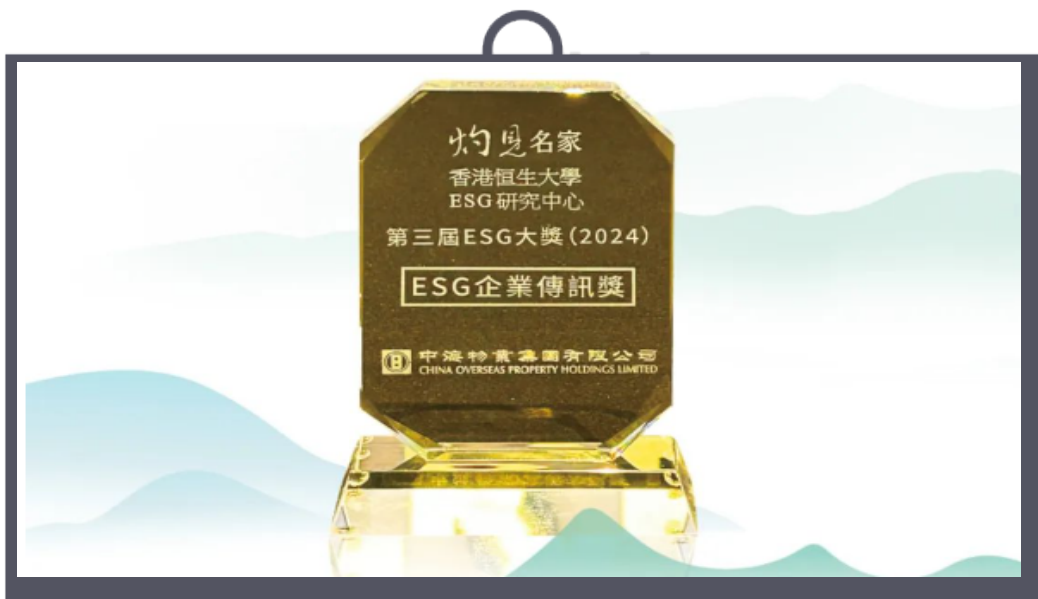
中海业获得ESG企业传讯奖