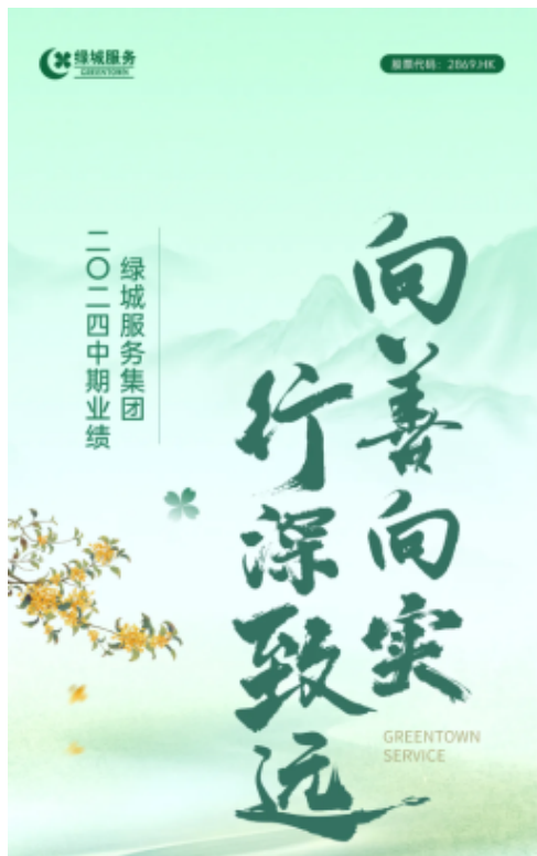
绿城服务中期业绩亮点