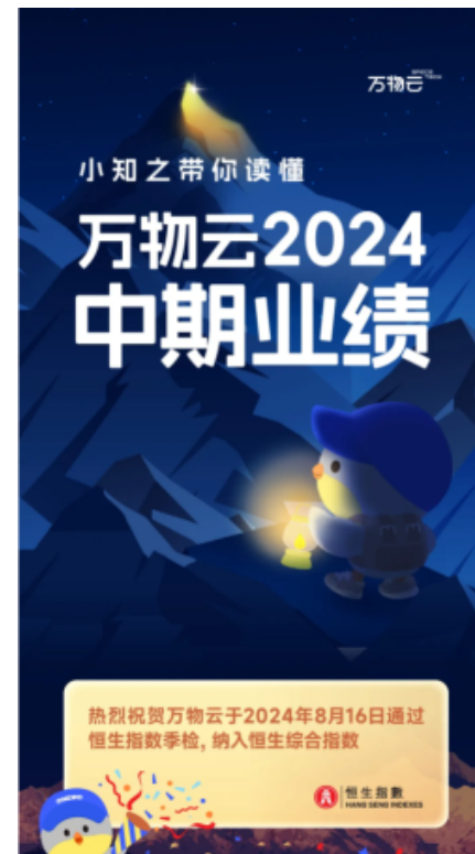
万物云中期业绩亮点