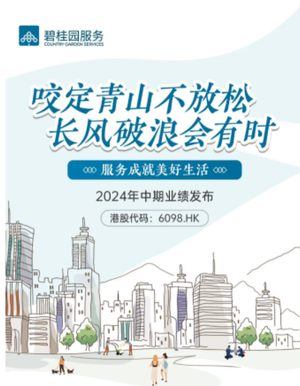
碧桂园服务中期业绩亮点