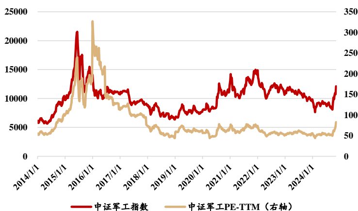
图表4：军工板块 PE-TTM 估值

截至 2024 年 11 月 8 日，中证军工指数为 12119.55，军工板块 PE-TTM 估值为 82.73，军工板块 PB 估值为 3.37。军工板块 PE-TTM 估值和 PB 估值均处于历史中部位置，自 2014 年 1 月 1 日起，历史上有 70.89% 的时间板块 PE-TTM 估值低于当前水平，58.74% 的时间板块 PB 估值低于当前水平。