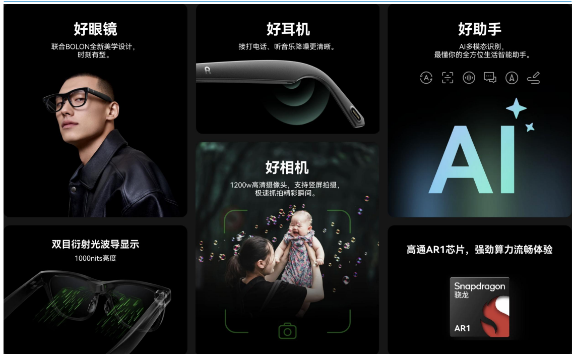
图 3: Rokid Glasses 亮点汇总