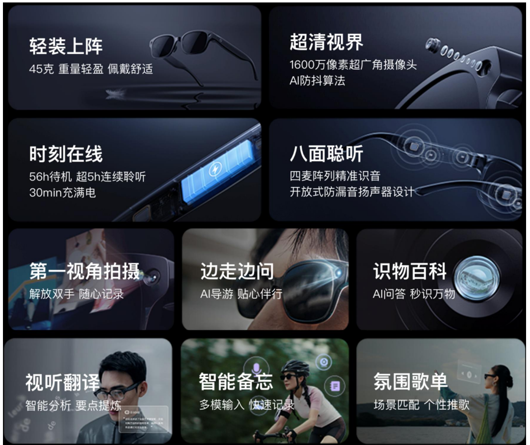
图 2: 小度 AI 眼镜亮点汇总