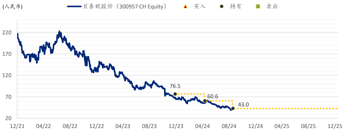
图表 4: SPDBI 目标价: 贝泰妮 (300957.CH)