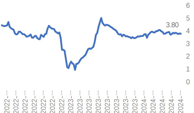
图3：封闭6-12个月固收产品近6月年化收益率均值（%）