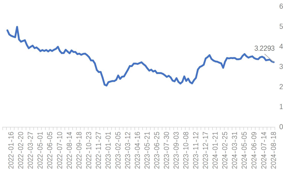
图 4：封闭 1-3 年期固收理财近 1 年年化收益率均值 (%)